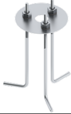
Anchor bolt A10791