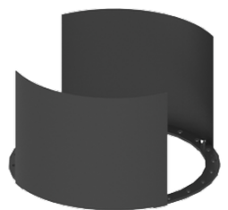
Light shield 90° A10831