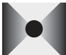
Sensor location 2 sides 2MW