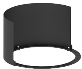
Light shield 180° A10731