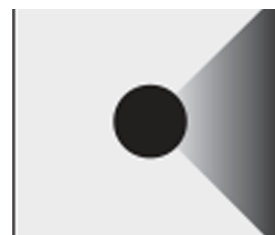
Sensor location 1 side 1MW