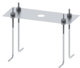
Anchor bolt A10991